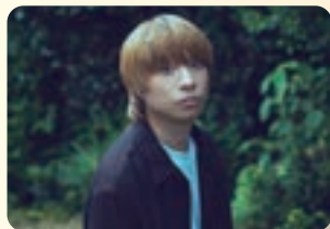
クリープハイブ 尾崎世界観

「びあpresents クリープハイブ尾崎世界観とラランド ニシダのダブルスタンダード」がスタジオを飛び出し、特別トークショーを開催!第一線で活躍するお二人が、エンタメのリアルと働く面白さを語り尽くす、学生必見のプレミアムステージです。